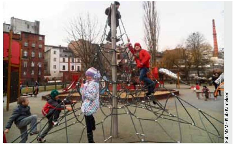
Na placu zabaw na Wyspie Młyńskiej w Bydgoszczy