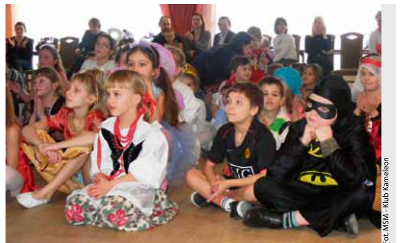
Ostatnim akordem ferii i półkolonii był bal przebierańców