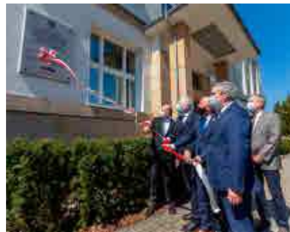
Odstąpienie tablicy pamiątkowej na gmachu Urzędu Marszałkowskiego w Toruniu.

– „Solidarność” rolnicza odegrała istotną rolę w tym, by mogła się dokonać pokojowa transformacja polityczna w naszym kraju. To była jedna z kluczowych ról w tym procesie. Nie zapomnijmy o tym, że „Solidarność” była malowana solidaryczną nie tylko na czerwono, ale również na zielono – podkreślił marszałek Piotr Całbecki, nawiązując do słynnego logo „Solidarności” w przemówieniu z okazji 40. powstania Niezależnego Samorządnego Związku Zawodowego Rolników Indywidualnych „Solidarność”. Okolicznościowe uroczystości zorganizowane przez Urząd Marszałkowski odbyły się 12 maja w Toruniu, Inowrocławiu i Łubiance.