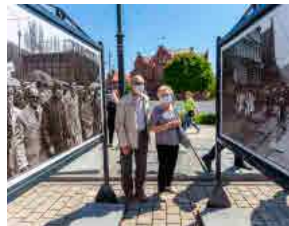
Jednym z punktów uroczystości było otwarcie wystawy poświęconej Solidarności rolniczej.

– „Solidarność” rolnicza odegrała istotną rolę w tym, by mogła się dokonać pokojowa transformacja polityczna w naszym kraju. To była jedna z kluczowych ról w tym procesie. Nie zapomnijmy o tym, że „Solidarność” była malowana solidaryczną nie tylko na czerwono, ale również na zielono – podkreślił marszałek Piotr Całbecki, nawiązując do słynnego logo „Solidarności” w przemówieniu z okazji 40. powstania Niezależnego Samorządnego Związku Zawodowego Rolników Indywidualnych „Solidarność”. Okolicznościowe uroczystości zorganizowane przez Urząd Marszałkowski odbyły się 12 maja w Toruniu, Inowrocławiu i Łubiance.