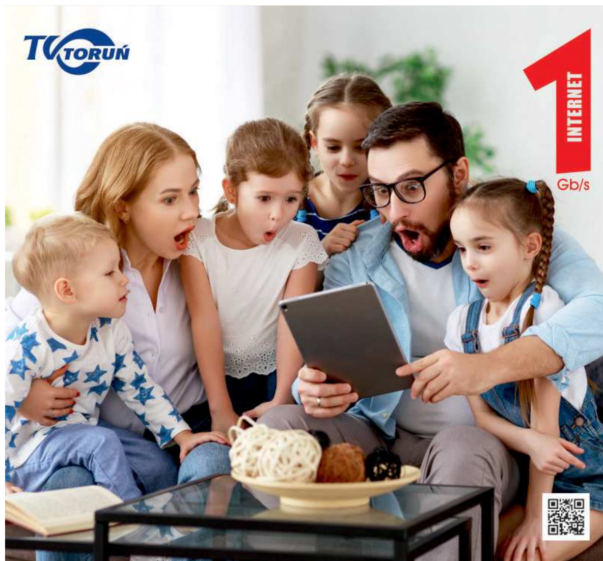
TVK Toruń przygotowała atrakcyjne plany taryfowe oraz korzystne opcje zakupu smartfonów i modemów

Jubileuszowa promocja Telewizji Kablowej Toruń wraz z podstawową ofertą stacjonarnych usług świadczonych poprzez nowoczesną światłowodową sieć kablową,